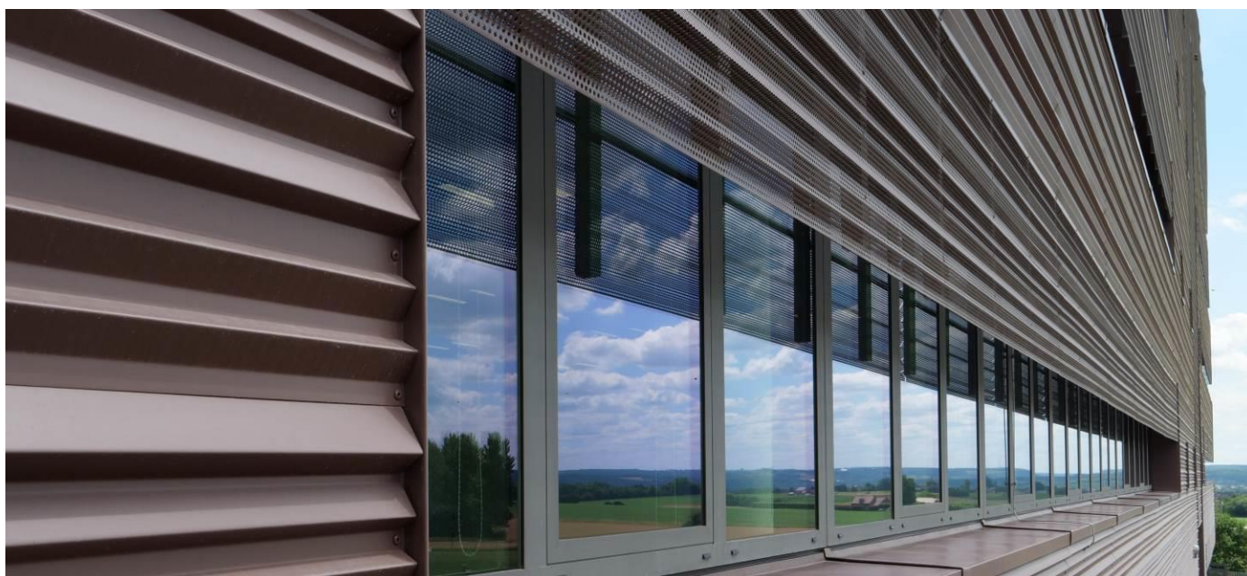
PROFIL NERVURÉ - PIGMENTO® ROUGE TERRE - ARCHITECTES : AD'A ET ATELIER 4D