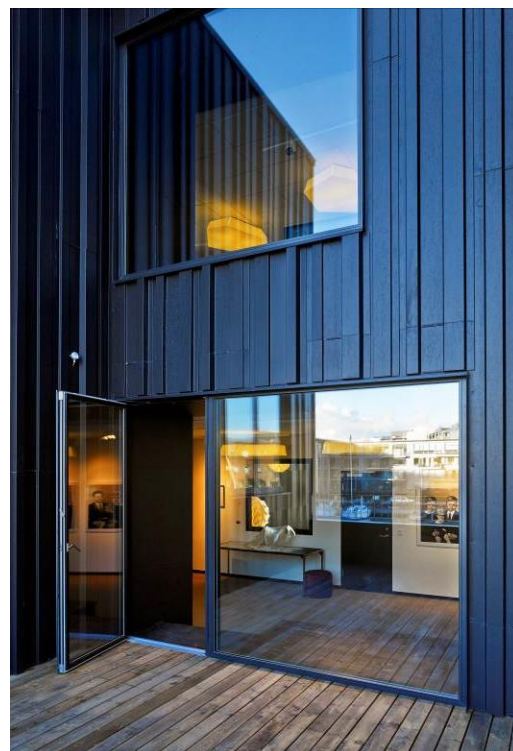
PROFIL NERVURÉ - ANTHRA-ZINC® ARCHITECTES : CORNELIUS+VÖGE APS & ISAGER ARKITEKTER

Ce type de pliage est imaginé et conçu pas à pas par les équipes techniques VMZINC®, en collaboration avec les architectes . Elles les accompagnent à toutes les étapes, de la phase de réflexion à la mise en œuvre sur chantier. Une proximité qui les encourage dans leur créativité et repousse sans cesse les limites du zinc . Un matériau malléable et pliable, qui permet d'épouser toutes les formes dont les plus complexes.