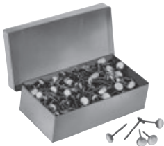
Boîte de 500 pièces