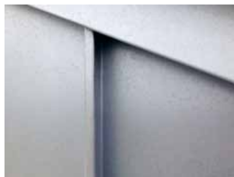
VMZ Joint debout en AZENGAR®

Toutes régions vent Toutes zones sismiques.