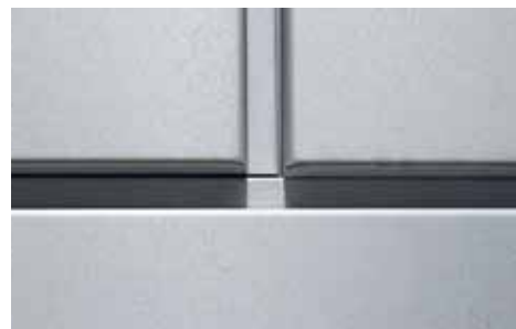
VMZ Mozaik® en AZENGAR®