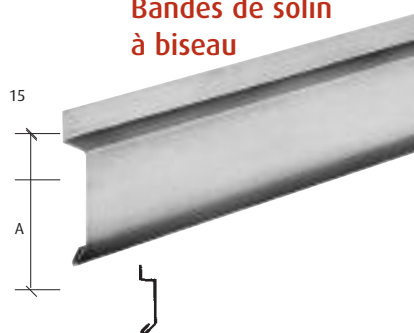
Bandes de solin à biseau