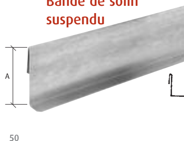
Bande de solin suspendu