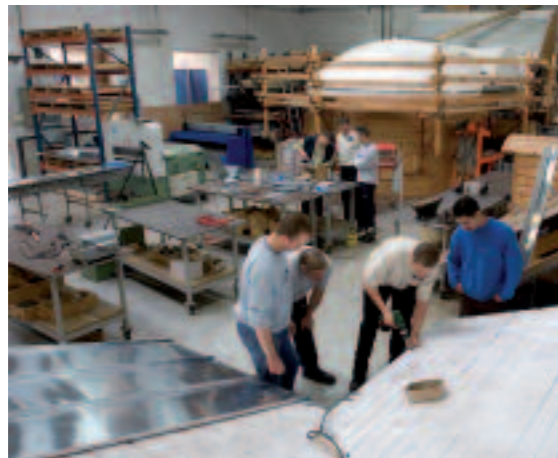
Atelier de formation PRO-ZINC à Bray-et-Lû (95)

Ces stages sont dispensés en centre de formation ou sur chantier, dans des conditions réelles de travail, sur des maquettes grandeur nature qui représentent tous les cas de figure rencontrés sur chantier.