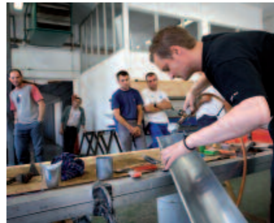
Atelier de formation PRO-ZINC à Viviez (12)