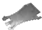
Tracette à zinc