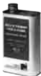
Huile de patine pour le plomb